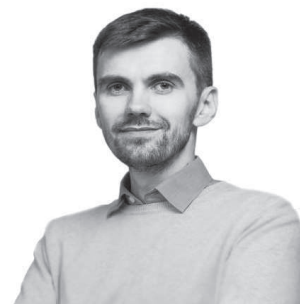
Павло Ковтонюк Заступник міністра охорони здоров'я

Для керівників закладів головним завданням буде реорганізація в некомерційні комунальні підприємства. Це дасть закладу можливість мати значно більше свободи у прийнятті щоденних рішень, мати рахунок закладу в банку,