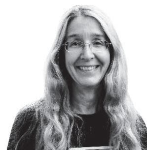
Доктор Уляна Супрун, в.о. Міністра охорони здоров'я

Те, що не увійде до програми «Доступні ліки», буде включено в тарифи на послуги, які, згідно з реформою, будуть закуповуватись у лікарнях з 2020 року.